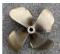
Vor der Reparatur