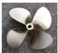
Nach der Reparatur

Wir reparieren Bootspropeller aus Bronze, Alu, Nibral oder rostfreiem Stahl. Mittels Spezialwerkzeugen und Negativmodellen der jeweiligen Hersteller werden Steigung und Blattwinkel, sowie Flügelgröße wieder exakt einjustiert, feingewuchtet und maßgerecht ausgearbeitet. Oberfläche nach Wunsch: Feinschliff, Politur, Lack oder Antifouling. Steigungsänderungen und/oder die Anpassung des Durchmessers zur Drehzahlanpassung, Anti-Singkanten auf Wellenpropellern oder Feintuning von Edelstahlpropellern jederzeit möglich.